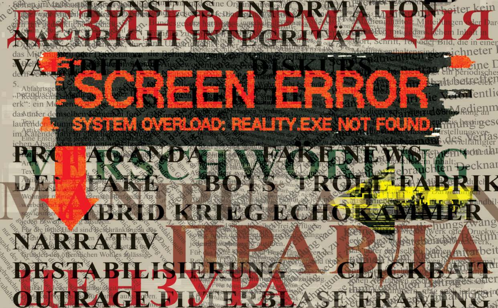
Illustration: Bundesheer/ Natalie Maniecka „Screen Error“